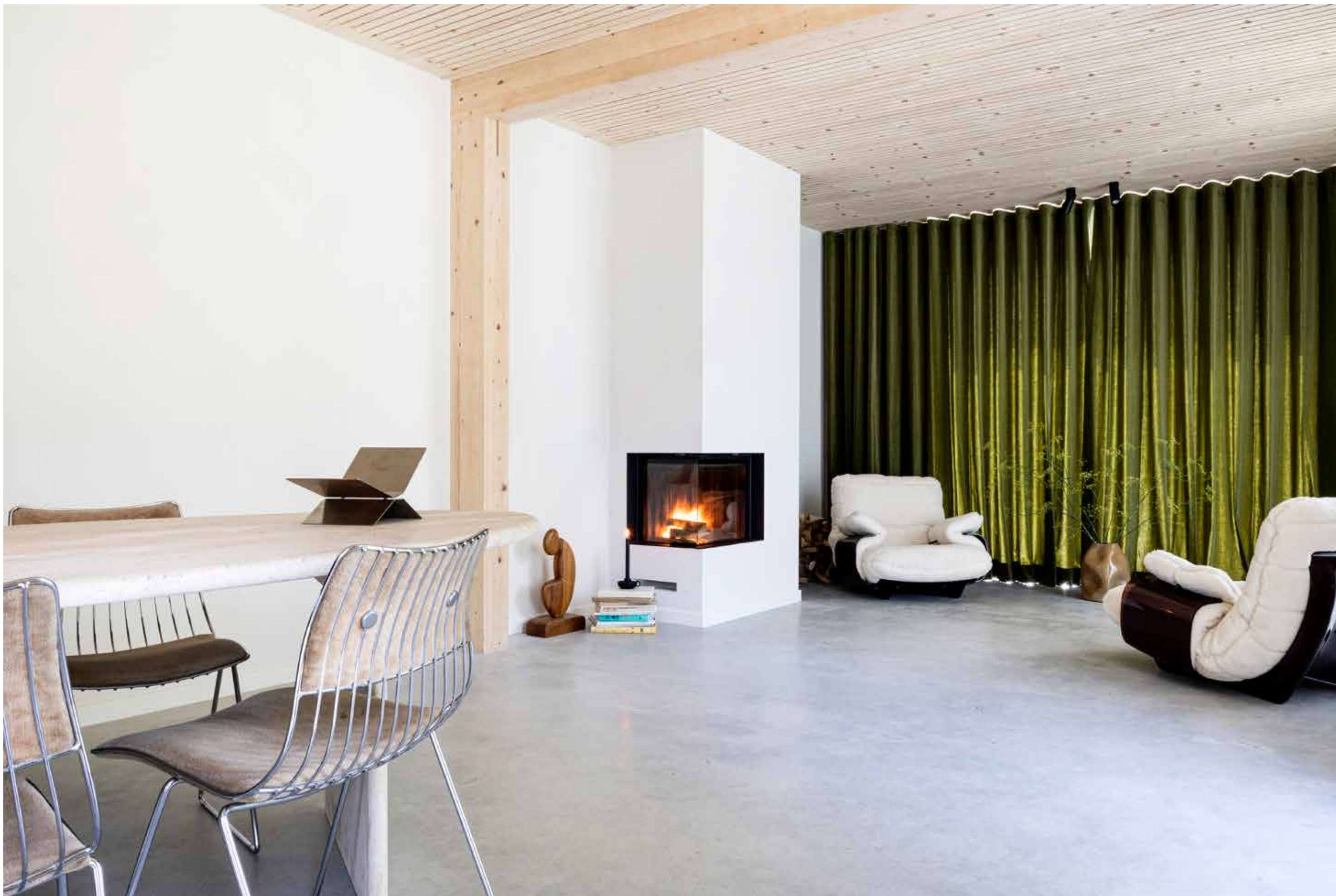
De winterkamer straalt warmte uit door de mix van natuurlijke materialen, zoals wol, linnen, velours, hout en natuursteen.