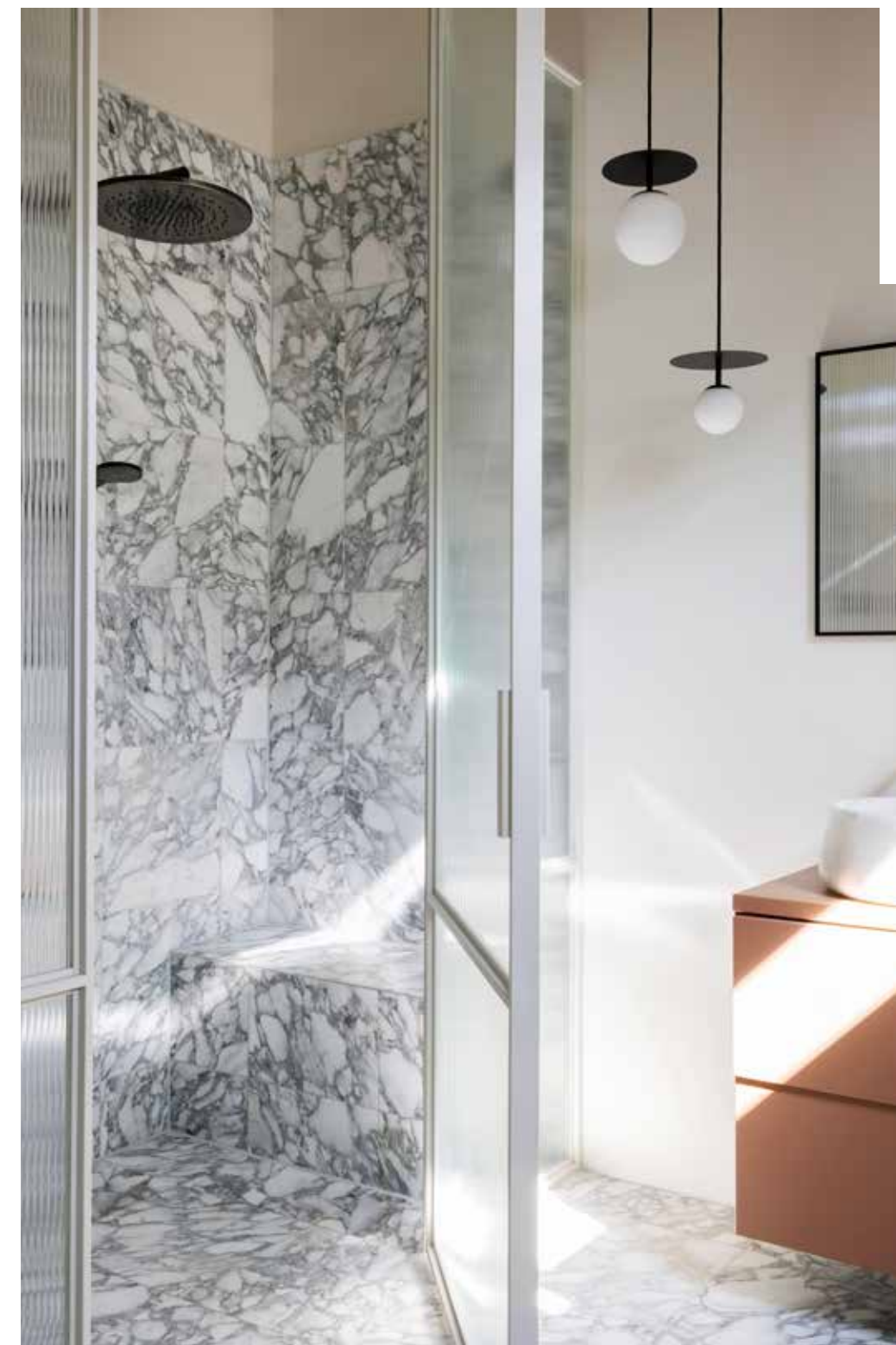
Bij de badkamer is een stuk van de aangrenzende logeerkamer getrokken om een ruime douchenis te installeren. De deuren met ribbelglas zijn maatwerk (Interior Elements). De tegels van arabescatomarmer zorgen voor een levendig patroon op muur en vloer. Wastafel, waskommen en bad van Detremmerie, kranen van Gessi, lampen van TossB.